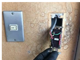
②スイッチ配線確認