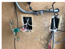
⑦照明スイッチを配線