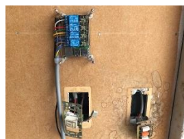
③仮止め配線取り回し