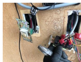
⑤配線図に従って接続