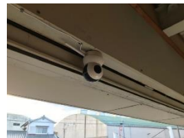
⑩専用カメラの設置