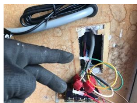
⑥停止スイッチ切断圧着